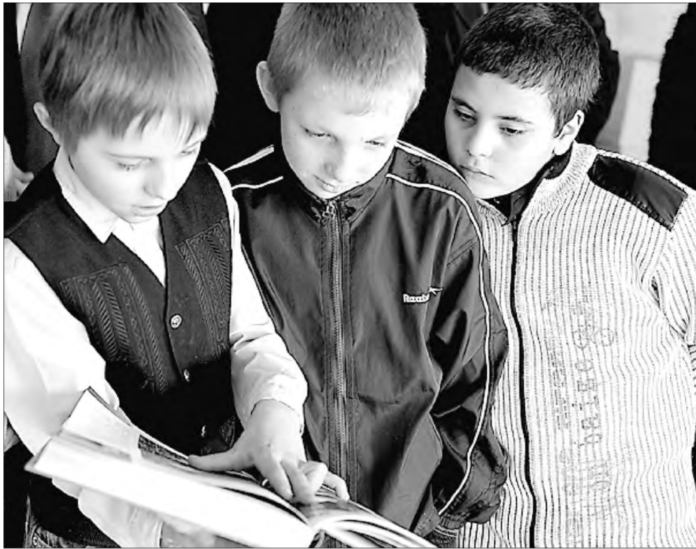
Читают ли современные дети? Мнения издателей разделились

Проблема нечтения не связана с наличием или отсутствием хорошей современной прозы или поэзии. Когда маленький человек начинает приобщаться к книге, для него все вновь, каждая буква, каждое слово. Поэтому вопрос о «некачественности» Пелевина или Мураками сегодня не стоит. Когда наше поколение вступало в жизнь, согласитесь, нам хватало книг, которые можно было почитать. Все они никуда не делись, и при-