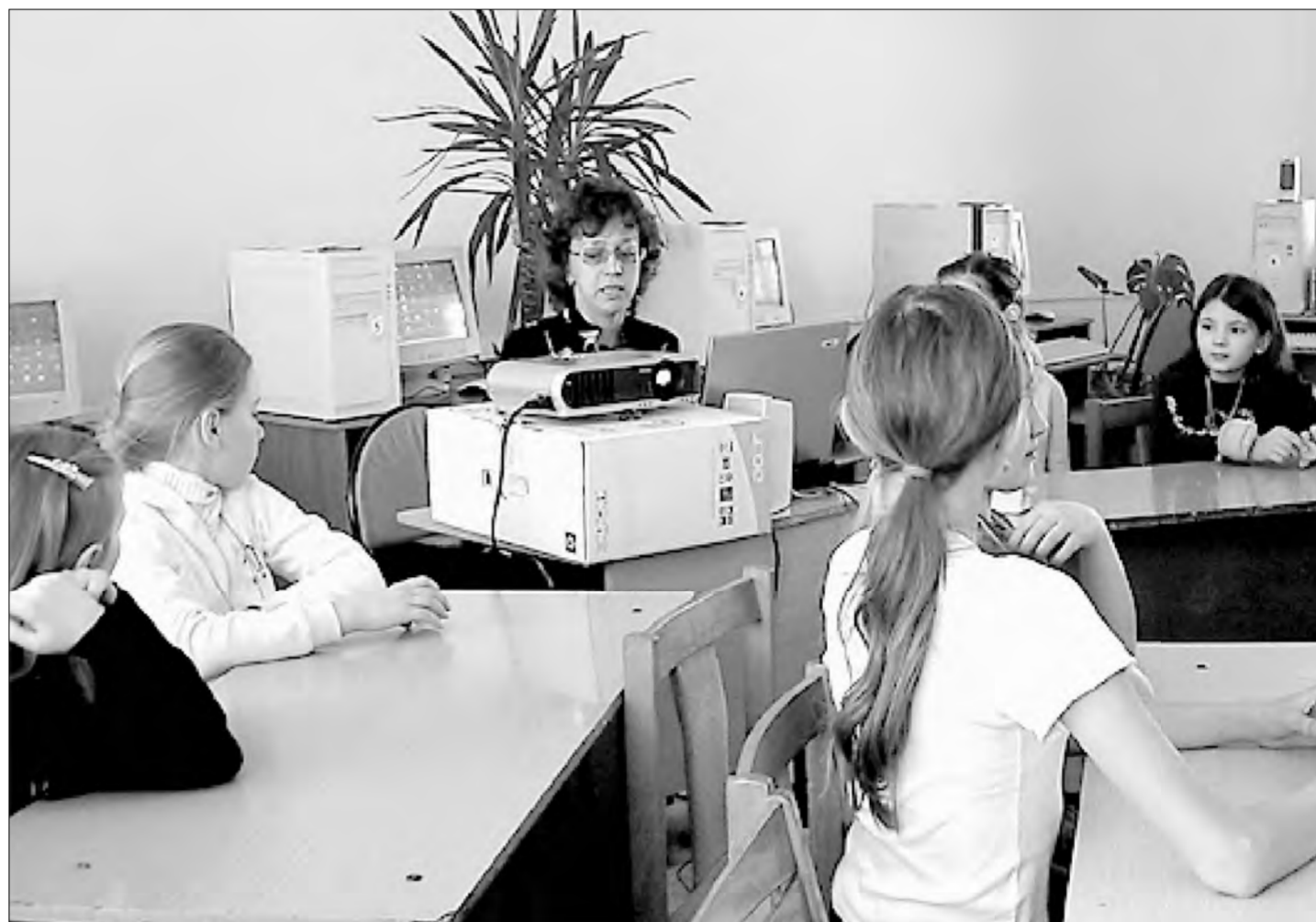
Сначала революцией стало появление письменности, затем — первой печатной книги, сегодня — новых источников информации

Российский книжный союз считает необходимым заострить внимание и органов власти, включая правительство, и системы образования на тех рисках, которые несут в себе перечисленные проблемы. Необходимо принять все меры, чтобы сформировать ту самую читательскую культуру,