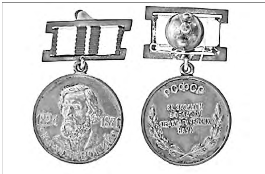
Медаль К. Д. Ушинского вручают за серьезную научную, исследовательскую работу в области педагогики

Но нужно сказать о такой проблеме. Администрация школ не всегда способна так подготовить характеристику претендента, чтобы в полной мере показать его профес-