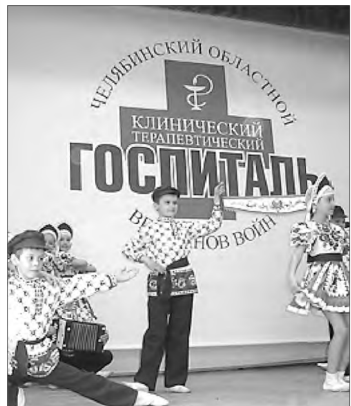
Благотворительный концерт в госпитале в честь 60-летия ВОВ. На сцене — хореографический коллектив школы № 45 «Веснушки»

Участники находятся в постоянном движении: «Шля пощю. уже наша!», «к нам приходит КЭТРИН, г-жа Прелюбия, а как к маске. Например, «алекса», «информацион», «belvaljak», «egor», «joy76», «mishaxxx». При завязывании контакта пользователь представляет себя виртуальному сообществу. Выбор ника, т.е. виртуального имени, определяется прежде всего оригинальностью. Собеседники должны быть поражены безграничностью творческой фантазии автора сообщения или непредсказуемостью характера персонажа. Как правило, участники виртуального общения не ограничиваются реальными или вымышленными именами собственными, привычными для традиционных форм общения. Молодой человек выбирает себе роль, руководствуясь следующими принципами: любимый персонаж, отрицательный герой, который будоражит воображение своей «гадкостью», или, наоборот, выдающаяся личность, популярное имя («Пьер Безухов», «Гагарин Юра», «св. Герман», «Леди Ди», «Незнайка», «Обломов», «Собакевич», «Софокл», «Фома Неверующий», «Хрюша»). Иногда пользователь присваивает себе ник, который может сообщить собеседнику о профессии участника, его слабостях и пристрастиях, его притязаниях на определенное положение в обществе или профессиональной деятельности («Доктор Сэнди», «Одинокий Я», «Одна из продавщиц», «Странная Я», «Художник»). Таким образом виртуальный коммуникант громко заявляет о себе как о личности неповторимой, отличной от других. В физическом смысле виртуальная реальность представляет собой некое пространство, заполненное голосами