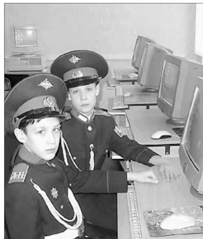
В информационном центре школы

Сайт издательства «Взгляд» www.icv-kniga.ru Заходите!