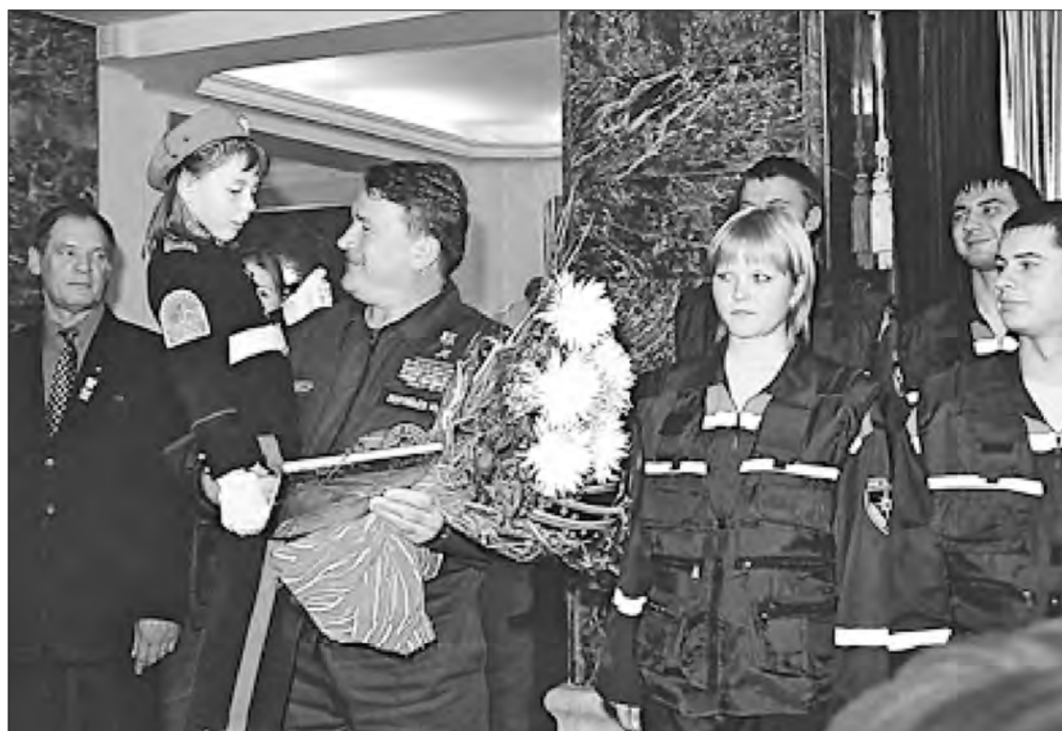
На праздновании 15-летнего юбилея МЧС (2006) в Челябинске присутствовал замминистра ГО и ЧС С. Л. Воробев (в центре)

Партитура школьного дня распланирована для учеников 45-й