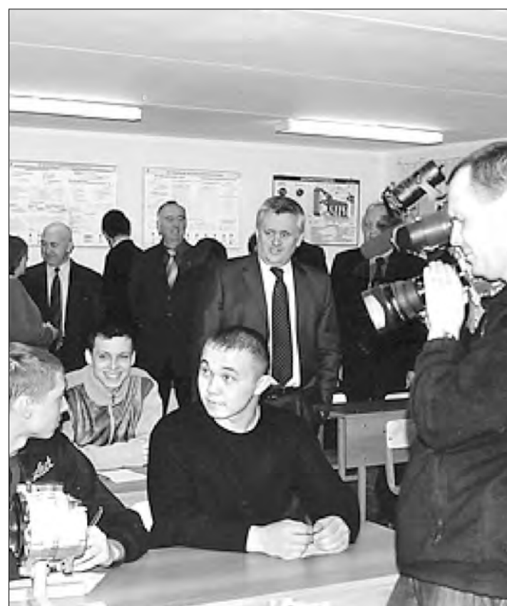
На открытии ресурсного центра в профессиональном училище № 99, г. Челябинск