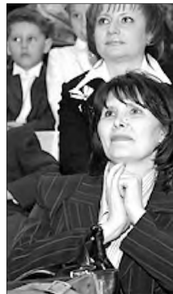
Ученики и коллеги конкурсантов переживали не меньше самих участников

Редакция выражает благодарность сайту ChelDiplom.ru за предоставленную информацию