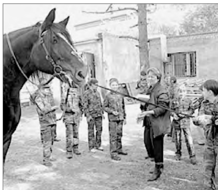
Тренировка в конном клубе «Гармония»

конный спорт, хореография и этика, геральдика и музейное дело. Ученики, занимающиеся баскетболом, входят в состав районной команды. В рамках конкурса «Серебряная маска» дебютировала