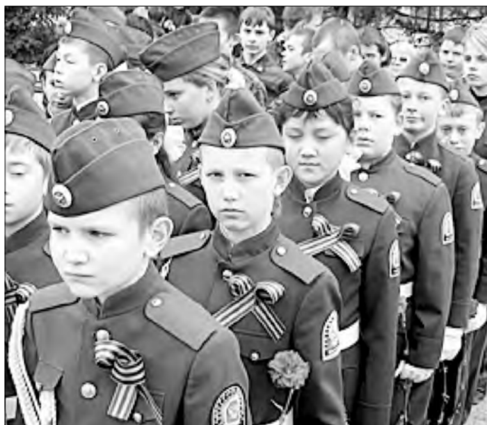
Участники торжественного парада на открытии Выхта памяти

Кем бы ни стали в будущем наши кадеты, главное, чтобы они пронесли по жизни то понятие чести, долга, нравственной чистоты, что прививают им сегодня их старшие наставники и друзья. Верим, что наши кадеты будут достойными защитниками Родины.