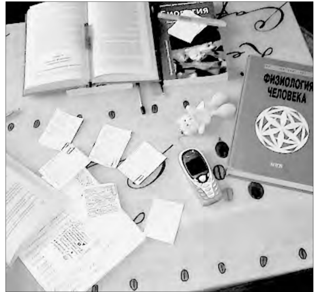
Современные выпускники все реже используют на экзамене шаргалки, написанные от руки, и все чаще — телефоны

В связи с тем, что размещение экзаменационных материалов производится с указанием ответственных лиц и времени получения, виною будет установить достаточно просто.