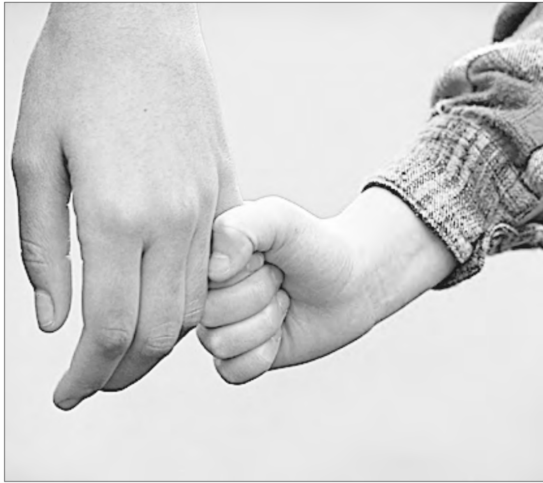
В обществе укоренились ложные суждения и несправедливые стереотипы по отношению к людям, живущим с ВИЧ.

самоунижения. Хороший уход за ребенком, рожденным ВИЧ-положительной матерью, может быстро привести все показатели физического и нервно-психического развития в норму. Ситуация может быть совсем иной, если мама ребенка является активным потребителем наркотиков и / или алкоголя и ведет асоциальный образ жизни. В таком случае рождение здорового ребенка весьма сомнительно, и связано это будет прежде всего с употреблением психоактивных веществ матерью до, во время беременности и после рождения ребенка. Как правило, у таких детей часто происходит задержка физического и нервно-психического развития.