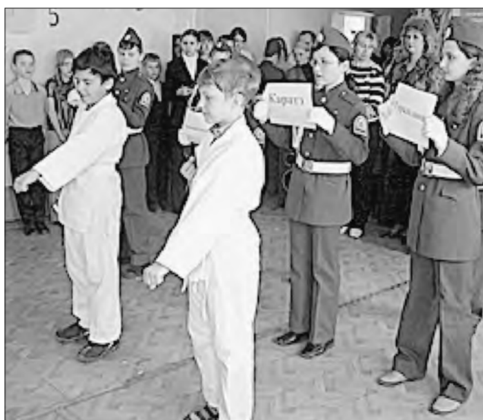
Занятия восточными единоборствами