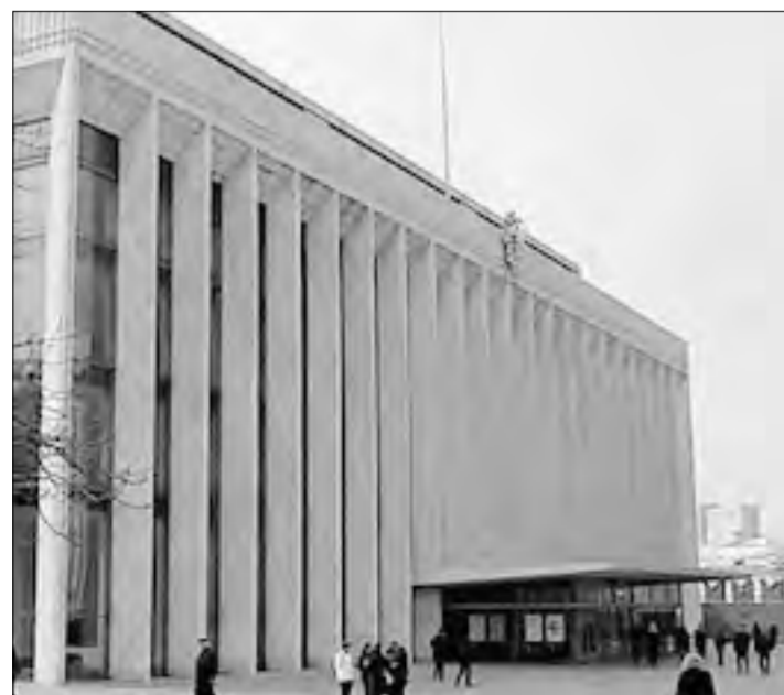
Праздник «Выпускник-2007» состоялся в Государственном Кремлевском дворце

Лучшие одиннадцатиклассники Южного Урала побывали в Москве на выпускном балу