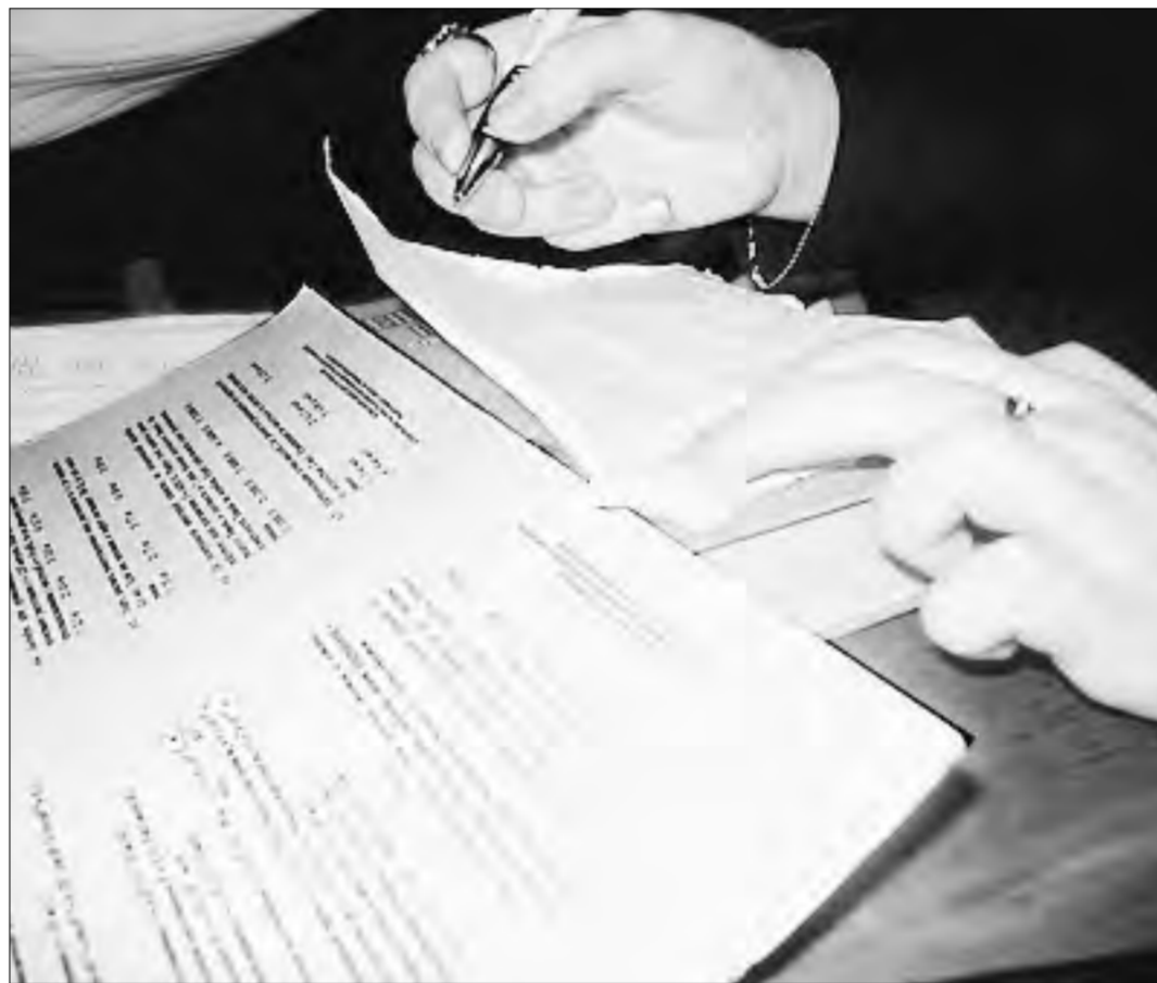
ЕГЭ задумывался как система оценки знаний выпускников, способная противостоять дискредитировавшим себя традиционным экзаменам

Самой обсуждаемой проблемой сегодня применительно к аббревиатуре ЕГЭ являются злоупотребления, подлоги, махинации, связанные с этим экзаменом. Поводом к тому явился поступок школьницы Ленинградской области, который поместил в Интернете прорешанные варианты реального теста за 10 часов до экзамена. Большой вопрос не как мальчик достал тесты, а зачем он поместил информацию в Интернете. Представляется, что из мальчишеского бахвальства — смотрите, какой я крутой! Чиновники всех уровней пытаются сделать хорошую мину при плохой игре: доказывают, что этого не может быть никогда («Никада и Ничаво», как говорил Хрюн Моржев в одной почившей в бозе передаче). Гадкий мальчик злодейски выкрал экзаменационный материал и понесет за это суровое наказание. Но любому человеку, мало-мальски знакомому с системой образования, ясно, как на самом деле это было: где-то близко к этим пакетам работал отец дядя, сосед, сосед соседа — и