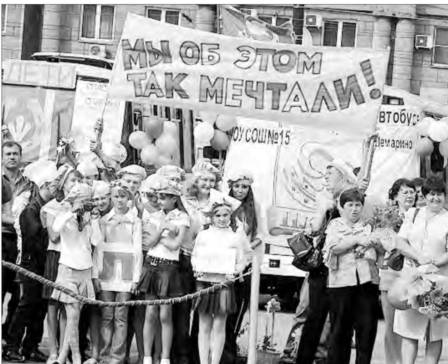
Благодаря нацпроекту образование получило значительную поддержку и со стороны субъектов РФ

Собственно, это было всегда: ученики, которые много