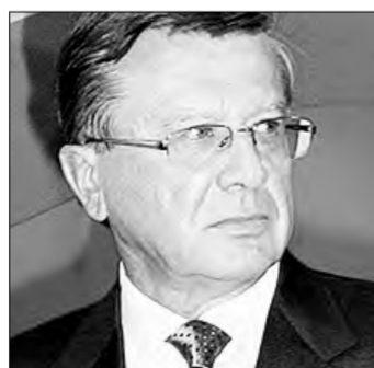
Новый премьер Виктор Зубков родился на Урале

В России новый премьер-министр и новое правительство