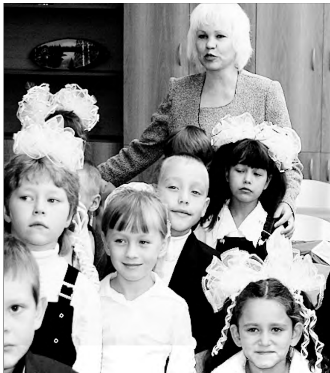
Новый законопроект закрепляет гарантированные объемы финансирования образовательной услуги, предоставляемой детям со стороны государства

Обсуждаемый законопроект в целом носит позитивный характер. Его обязательно нужно принимать хотя бы потому, что он законодательно закрепляет гарантированные объемы финансирования образовательной услуги, предоставляемой нашим детям со стороны государства. Являясь сторонником именно нормативного и именно подушевого финансирования, я не могу не признать, что предложенный документ является существенным шагом на этом пути. Нормативно-подушевое финансирование позволяет направить большее количество бюджетных средств в те учреждения, которые осуществляют более качественное образование и, в силу этого, являются привлекательными для населения. Родители стараются привести своего ребенка для обучения именно в эти школы, голосуют за них «ногами». Поэтому, в подавляющем большинстве, эти качественно работающие школы имеют большое количество школьников. И, как следствие этого, — относительно большие фонды оплаты труда. Те же школы, которые, в силу разных причин, снизили ка-