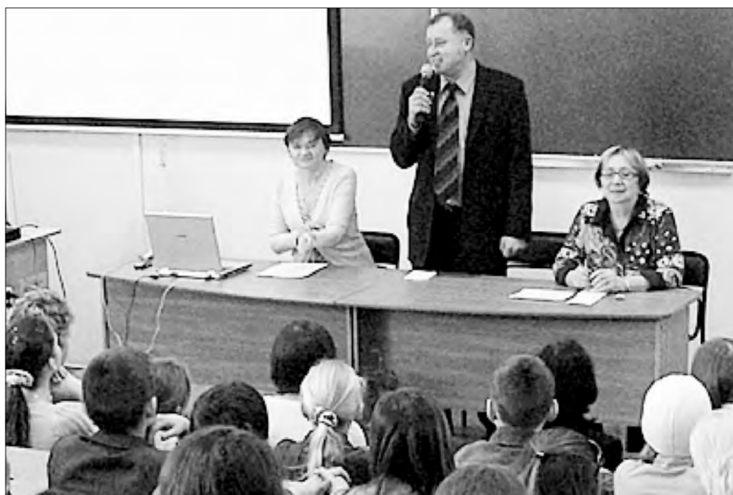
Центр довузовской подготовки ЧелГУ имеет большой опыт и сложившиеся традиции в работе со старшеклассниками

В условиях интенсивного развития информационно-телекоммуникационных технологий Челябинский государственный университет при поддержке Министерства образования и науки Челябинской области организует дистанционные образовательные курсы, обладающие рядом преимуществ: возможностью самостоятельно определять интенсивность и длительность занятий; возможностью работать в любое удобное для них время; возможностью многократного прохождения тестов; возможностью прослушивания открытых интернет-лекций, для которых разработана программа «Mentor. Открытые лекции». Эта программа осуществляет передачу в удаленный пункт, подключенный к сети Интернет, в режиме реального времени ключевых моментов