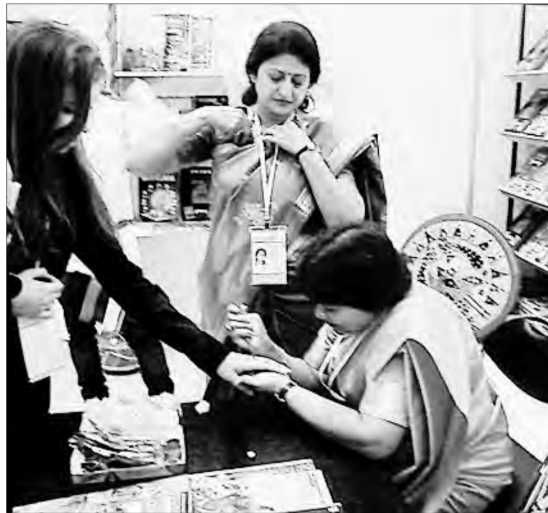
В Манеже были организованы выставки о книжной культуре различных стран. В фестивале приняли участие 22 государства

Первое направление исследовательской деятельности мы назвали «Жизненные стратегии творческих личностей». В качестве иллюстративного материала был выбран твор-