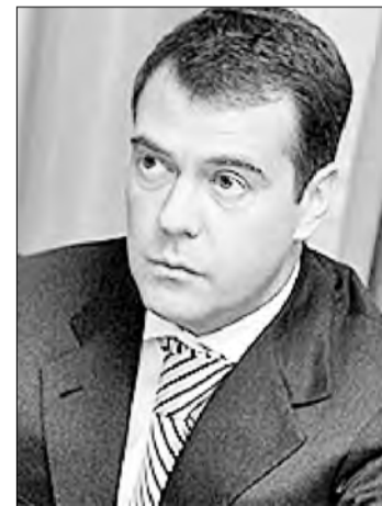
«Единая Россия» уже выдвинула своего кандидата в президенты РФ. Им стал вице-премьер Д. Медведев

Центризбирком России утвердил персональный состав Госдумы пятого созыва. Партию «Единая Россия» в новой Думе будут представлять 315 депутатов. От КПРФ зарегистрировано 57 депутатов, от ЛДПР — 40, от партии «Справедливая Россия» — 38 депутатов.