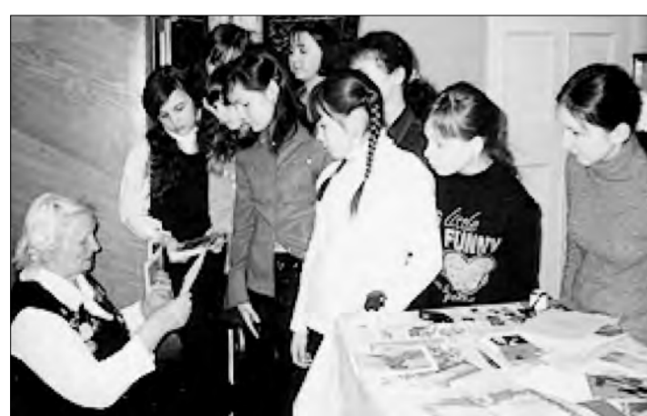
Музей — прекрасное средство патриотического воспитания, сохранения памяти, воспитания уважения к школе, учителю