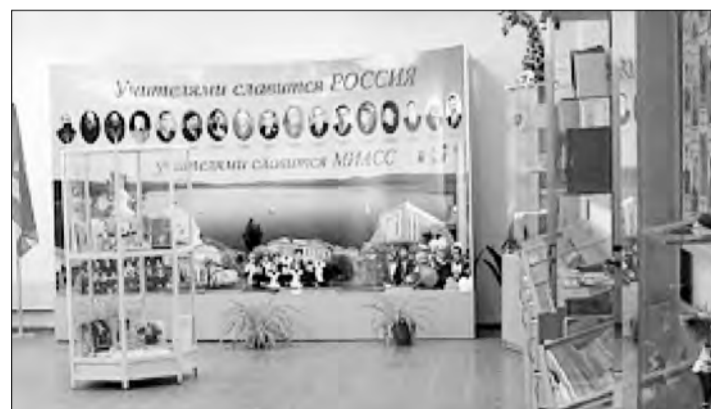
Центральное место в экспозиции занимает панорама «Учителями славится Миасс»

Остается добавить, что достижения музея отмечены наградами, дипломами, призами, грамотами. Все педагоги города уверены, что музей — прекрасное средство патриотического воспитания, сохранения памяти, воспитания уважения к школе, учителю.