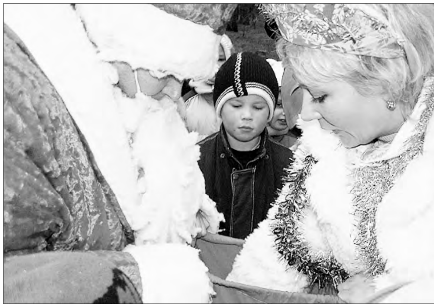
Жизнь каждого человека можно разделить на два больших периода: когда ты ребенок и праздник делают для тебя и когда ты взрослый и праздник делаешь ты сам для детей и близких

Новый год начинается с елки — это аксиома. Можно купить синтетическое дерево в магазине и наряжать его, чувствуя себя борцом за охрану природы. Кто-то признает только настоящую ель, и у него в доме будет пахнуть хвоей и шишками. Самый упорный вырастит ель во дворе или в горшке и будет наслаждаться праздником, который всегда с ним. Но от этого елка не изменит своего священного предназначения — именно под нее Дед Мороз должен положить свои подарки. А если нет елки, то куда? Все остальные