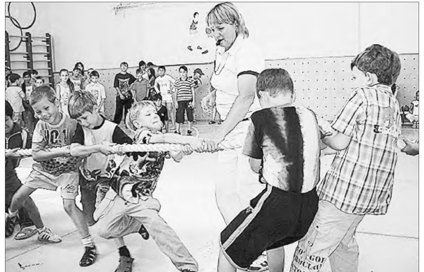
Основная функция педагогических работников на период летних каникул не меняется: это обучение и воспитание. Меняются лишь формы работы с учащимися или воспитанниками

К организации летнего отдыха детей на базе городского или сельского образовательного учреждения (общеобразовательной школы или учреждения дополнительного образования), как правило, привлекаются работники данного образовательного учреждения.