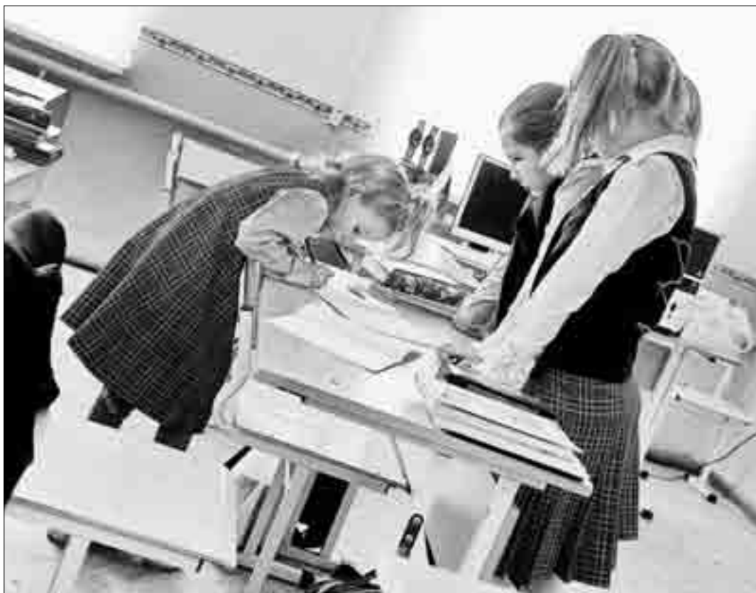
К 11-му классу нынешние первоклашки будут учиться в школе с современным оборудованием и молодыми педагогами

По словам министра, в области существует проблема тех-