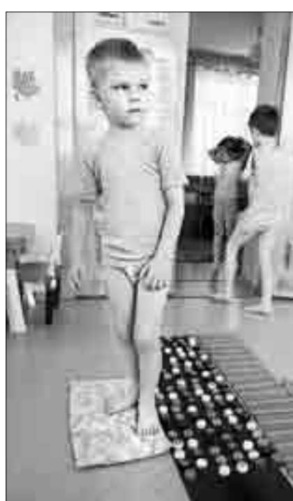
Молодые педагоги, современное оборудование, спортивные площадки и здоровьесберегающие технологии — все лучшее детям