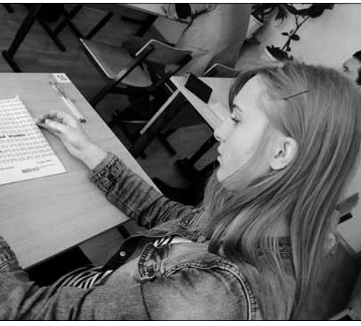
Содержимое контрольно-измерительных материалов строго охраняется государственной тайной.

«Для предотвращения нарушений процедуры ЕГЭ предусмотрена процедура видеонаблюдения. В большинстве городских и сельских территорий единственным интернет-провайдером был и остается «Ростелеком», чья деятельность и без прокладки отдельного соединения вызывает немало вопросов: скорость едва достигает положенных 2 Мб/сек, ширина канала ограничена, а стоимость услуг при этом зашкаливает. По словам организаторов, в 2013 году как самостоятельное мероприятие конкурс проводится в третий раз. С каждым годом составление приобретает все большую популярность, а том числе и среди представителей сильного пола: так, в этом году более трети участников – мужчины.