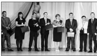
В числе конкурсантов вошли победители муниципальных этапов руководители кружков и спортивных секций, а также учителя общеобразовательных школ.

В финале за звание лучшего в профессии сошлись 21 педагог. В число конкурсантов вошли победители муниципальных этапов руководители кружков и спортивных секций, а также учителя общеобразовательных школ.