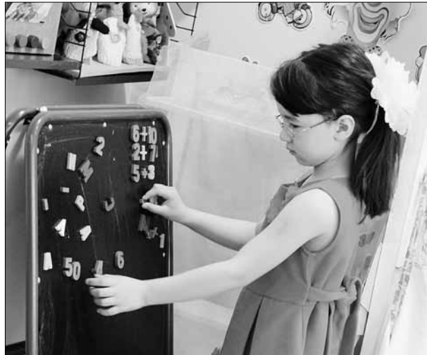
Еще до начала нового учебного года управленцы должны будут научиться считать деньги по-новому