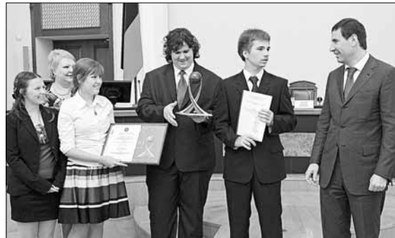
Ученики школы № 147 Челябинска рассказали о своем победном проекте «Золото из золы» губернатору >> 2

Кубок губернатора выиграла челябинская школа