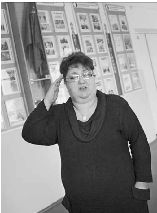
Вместе в бой, а там посмотрим... Директора лишены путей отступления от нового контракта

Причем речь идет сразу о двух новых формах – трудовом договоре для работника и для руководителей учреждений. » 6