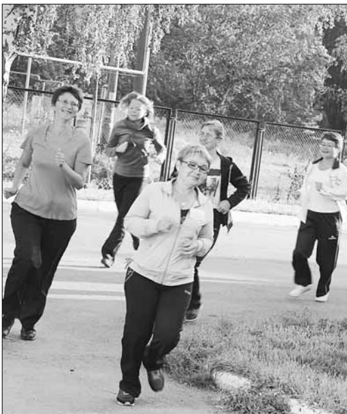
Каждое утро педагоги делали зарядку, и это позволяло им много работать и хорошо отдыхать

О том, что слет, как и всегда, будет открытой дискуссионной