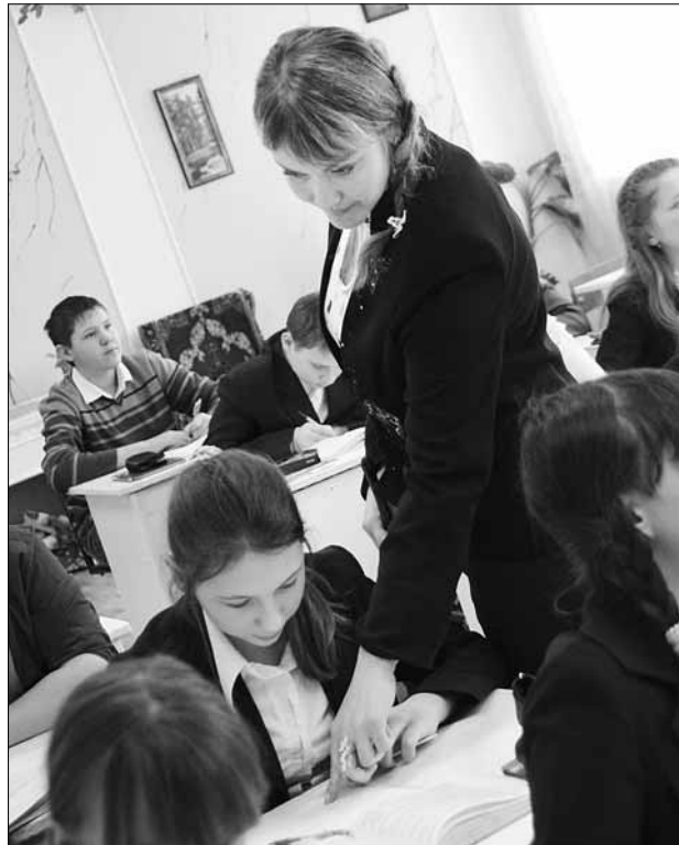
Окончившая учебу в вузе, молодой специалист приходит в школу и вновь начинает работу — быть педагогом