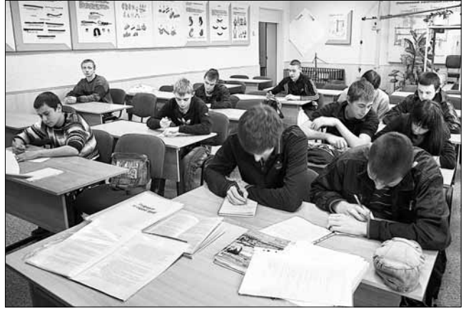
Сегодня вузы и суззы ведут наступление на работу для абитуриентов. Введение ее пока припроят

Кроме того, сегодня вузы в целях набора стараются работать напрямую с будущими работодателями, частично отпуская абитуриентов на практику.