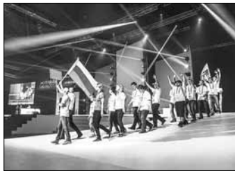
В 2013 году студенты российских вузов впервые вышли на международную арену чемпионата в Лейпциге