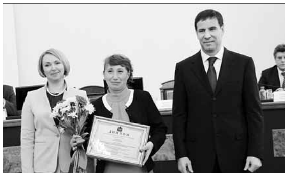
Учителей Челябинской области наградили премией за педагогическое мастерство и высокие результаты профессиональной деятельности

Губернатор отметил 100 лучших педагогов Южного Урала