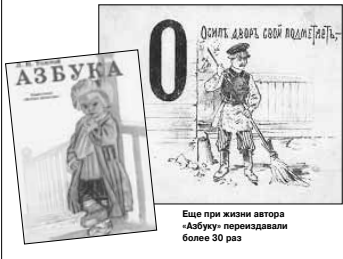
Еще при жизни автора «Азбуку» переиздавали более 30 раз

ВЫШЛО В СВЕТ ПЕРВОЕ ИЗДАНИЕ «АЗБУКИ» ЛЬВЫ ТОЛСТОГО