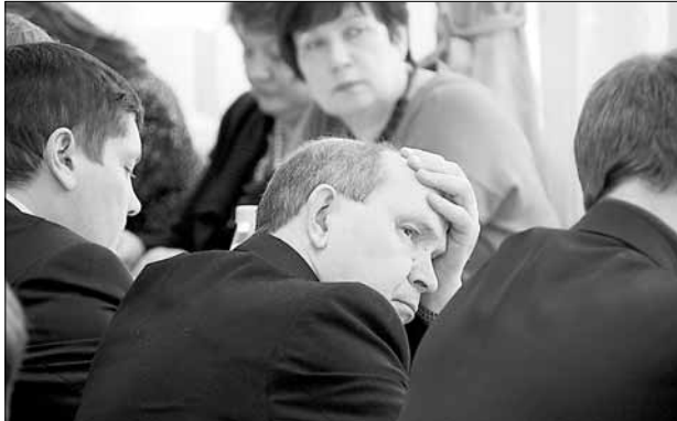
Перспектива оптимизации заставила чиновников задуматься о вечно: нехватке рабочих рук, росте документооборота, уровне зарплат и так далее

В отличие от зарплат, механизмы формирования базы школ пока в полной мере остаются неосвоенными. За приобретение оборудования, учебников ответственность равномерно распределяется между субъектом, муниципалитетом, школой, и доказать, кто кому и сколько должен практически невозможно. Субъект финансирует по нормативу, муниципалитет помогает в силу своих возможностей, школа покупает недостающее.