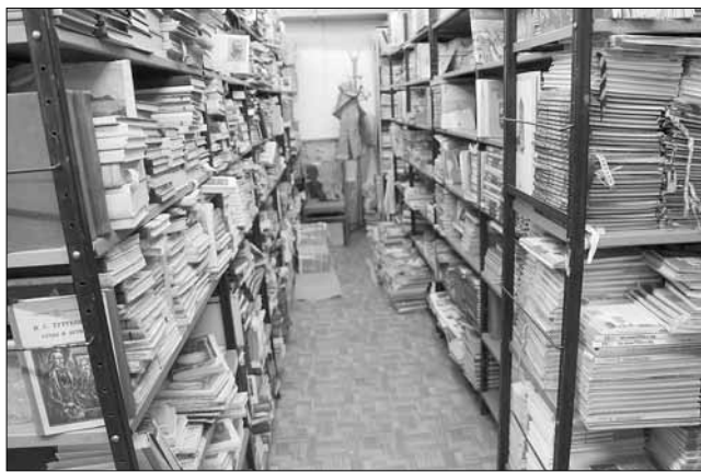
Новый федеральный перечень может упростить работу библиотекарей — вместо десятков на полках могут остаться единицы авторов

«Вопрос, к вузам и филиалам будут предъявлены одинаковые требования. С нашей точки зрения, их деятельность должна соответствовать одним и тем же критериям, поскольку они являются частью единого образования».