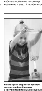
Ночью музеи стараются привлечь посетителей необычными и часто интерактивными лекциями

Еще одна большая проблема — отсутствие помещений. В условиях, когда критерием неэффективной работы руководителя становится наличие второй смены, а новыми стандартами вводится обязательная внеурочная деятельность, музейный кабинет для многих становится невозможностью расширения. В то время как хорошо работающий и полноценный кабинет музея рано или поздно вытесняется из каморки и требует сначала кабинета побольше, потом еще побольше, и еще... В Челябинской шко-