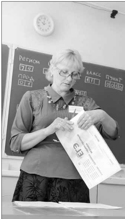
Организаторов ЕГЭ в этом году ожидало много сюрпризов

По мнению федерального Рособрнадзора, причина такого понижения порога в ужесточении правил проведения ЕГЭ. Напомним, это касается без аттестата. Снижение минимального балла сократило долю «двоичников» почти в два раза — до 4% от общего числа выпускников этого года. Особую озабоченность вызвали результаты ЕГЭ по математике. Меньше 20 баллов в Челябинской области набрали почти 500 школьников, а 100 баллов смогли набрать только 64 выпускника по всей России, и среди них конкурсанты нег.