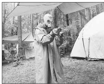
Слева: 5 дней, ночь — душ. Инфраструктура: жилая зона, зона приготовления пищи (полевая кухня), военно-спортивные площадки, пляж, спальный пост, полевые посты, зона для проведения мастер-классов и тренингов

«Вектор образования» познакомился с жизнью детей в палаточных лагерях