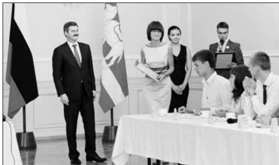
С призерами российского чемпионата рабочих профессий заглавы региона пообщался за чашкой чая. >> 2