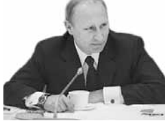
Владимир ПУТИН, президент Российской Федерации:

«Нужны специалисты, прежде всего в своих областях. Я не считаю себя вправе вмешиваться, есть министерство образования. У нас и бывший министр здесь сидит, который сейчас тоже поднимает образованием — ни за что не отвечает, но поднимает, вот такая хорошая работа»