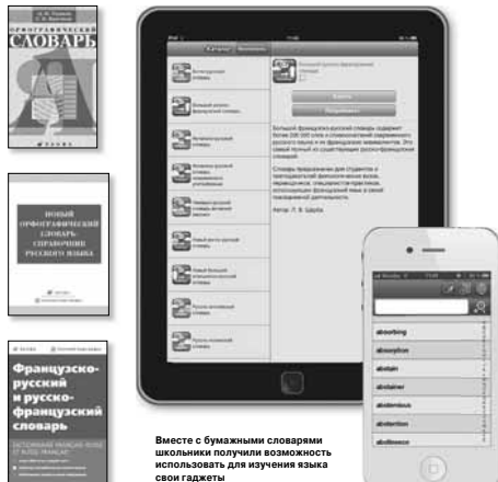
Вместе с бумажными словарями школьники получили возможность использовать их для изучения языка своих гаджетов