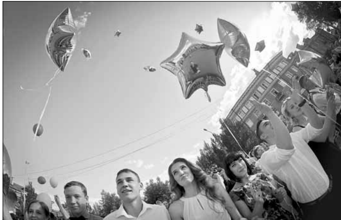
Бололе 14 тысяч южноуральских выпускников в этом году встретили расцвет взрослой жизни

— Мой сын спокойно и уверенно шел на все испытания. Чем сильнее становился, тем больше самостоятельности проявлял. Он мне всегда говорил: «Мам, ну я же учил, все будет хорошо».