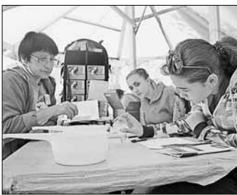
Слева: 3 дня, ночь — душ. Инфраструктура: жилая зона, санитарная зона, зона приготовления пищи (2 газовые плиты, работающие от баллонов), досуговая площадка, полевые лаборатории

«Ряд существующих сегодня, в том числе и санитарных, норм существенно сужает круг каких-либо изменений в формировании образовательного пространства и затрудняет возможные модернизационные решения»