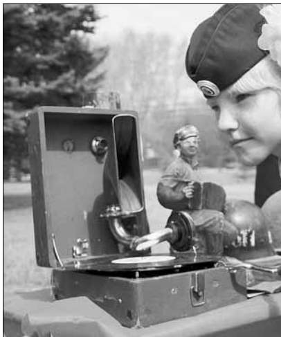
Великая Отечественная война с каждым годом все больше превращается из живой истории в музейную: чем меньше среди нас остается участников этих событий, тем меньше знают о них школьники

Южноуральские учителя получат по 200 тысяч рублей. Минобрнауки РФ опубликовал итоги ежегодного отбора лучших педагогов. В список вошли 23 южноуральских педагога. Почти половина из них — преподаватели из Челябинска. Общий конкурс составил 4 человека на одно место.