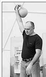
Борис ДУБРОВСКИЙ поднял гирю 67 раз

Спортивный праздник, куда юным врио губернатора сдал норматив по гиревому спорту и получил золотой значок ГТО на рук депутата Госдумы Николая ВАЛЮЕВА, состоялся уже на следующий день после выхода федерального положения о комплексе ГТО. Как и ожидалось, испытания и нормативы спортивного комплекса разделились на 11 возрастных групп и объем коридора от 6 до 70 лет. До совершенства эти группы поделены на духовные периоды, а после 30 лет — на 9-летие.