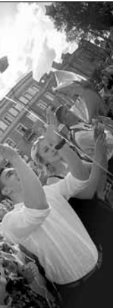
Бололе 14 тысяч южноуральских выпускников в этом году встретили расцвет взрослой жизни

Также непонятно и то, что дети сегодня в большинстве случаев приходится обращаться к репетиторам. Я считаю, что школа, которая называет себя