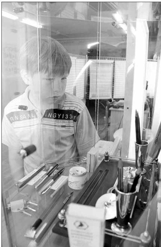
Закрытые витрины убивают интерес детей к истории вещей

Однако в начале 90-х государство меняет свою политику в области образования и сообщает школам, что отныне их единственной обязанностью остается только образование. О воспитании в учебных заведениях не вспоминают в течение почти десяти лет. Школьные музеи тоже становятся жертвами новой идеологии. Экспонаты складывают в коробки и отвозят на свалку, а помещения либо трансформируют в классы, либо сдают в аренду. >> 2