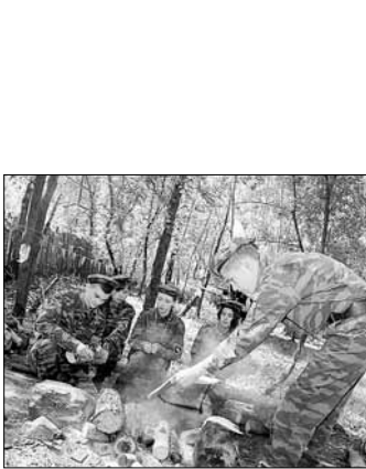
Слева: 5 дней. Инфраструктура: жилая зона, спортивная зона, хозблок, Инфраструктура: жилая зона, спортивная зона, хозблок, санитарная зона

Применение насилия в отношении подработника и его публичное оскорбление предлагается приравнивать к применению силы или оскорблению в отношении представителя власти.