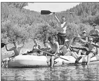
Слева: 5 дней. Инфраструктура: жилая зона, спортивная зона и зона отдыха, санитарная зона (с подводящей горелкой и холодной водой), Питание в столовой соседней лагеря

Палаточный лагерь «Ташангир», поселок Полетаево, Сосновский район