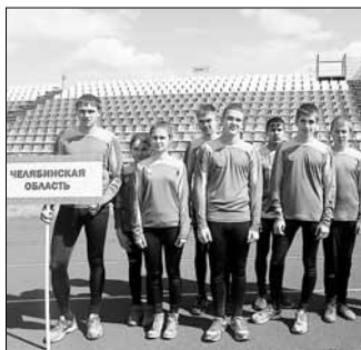
Команда военно-патриотического клуба «Барс» Центра дополнительного образования детей Красноуральского района впервые вошла в число финалистов российского конкурса, заняв третье место. >>> 3

Южноуральские школьники стали призерами Всероссийского соревнования «Юный спасатель»