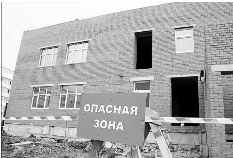
Строительство детских садов для многих муниципалитетов стало зоной повышенной опасности – спрос за выполнение планов оказался слишком высоким

До 2016 года в России должна появиться сеть дошкольных учреждений, способная вместить растущее число детского населения. Однонаправленный путь оказался далек от идеальной модели