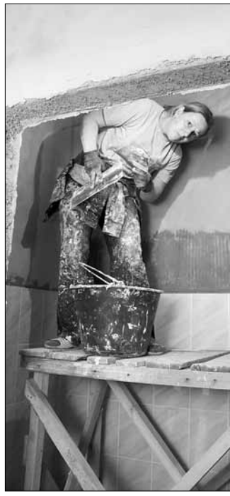
Контроль за строительством детских садов был и останется неупущим – таково требование всех уровней власти

«Очевидно, что в настоящее время мнением студентов, что деньги пришли только, во второй половине года».