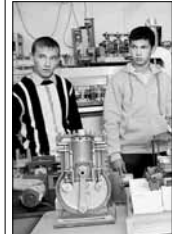
Теперь отличная квота позволяет студентам техникума поступить в вуз

Новый порядок приема сохранит право абитуриентов получать дополнительные