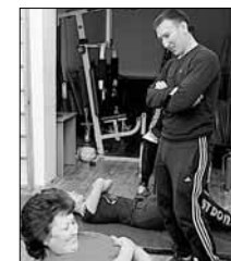
Упражнения на пресс некоторые оказались не под силу

Педагоги разделили на три возрастные группы: 18–29 лет, 30–39 и 40–59 лет. Они должны были с места прыгнуть как можно дальше, выполнить упражнение на пресс, подтянуться на перекладине, а также проверить свою гибкость, достав руками до пола с лавки. Для тех, кому исполнилось больше 50 лет, задание упростили, разрешив не подтягиваться на лавку. Все одним необходимым нормативом стало опоминание от пола. Мужчины предлокали еще и опоминание гирей весом в 16 кг.