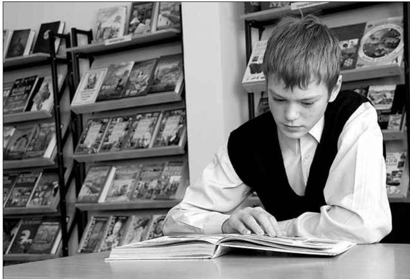
Старшекласснику для подготовки к ЕГЭ надо прочитать более 4 тысяч страниц текста только по литературе

«Основная функция воспитанника – осуществлять обратную