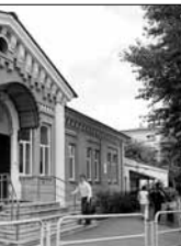
Сегодня в Комитете по делам образования Челябинска работают 65 человек