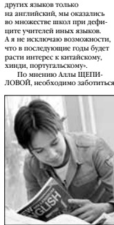
С 2022 года всем российским школам предстоит сдавать ЕГЭ по иностранным языкам