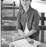
Роман популярной французской писательницы Морель Барбери «Элегантность эванизма» вышел в свет в 2015 году тиражом 700 тысяч экземпляров и был переведен на 31 язык

И, наконец, японец Оцу, до этого странно ставивший за ребенка, производящего впечатление не рано повзрослевшего, а рано «покастеровшего».