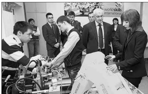
Сузы готовы приглашать школьников в свои лаборатории, но только за деньги

По результатам проверки составляется акт, который получают провизорская организация, министр образования и ФСБ. Этот документ не передается администрации организации. Проверки в Челябинске будут идти до мая и возобновятся в августе, после перерыва на время проведения экзаменов. В августе-декабре мы посетим Копейск и Южноуральск, а также Коркинский, Еманжелинский, Еткульский, Сосновский, Красноармейский и Увельский районы.